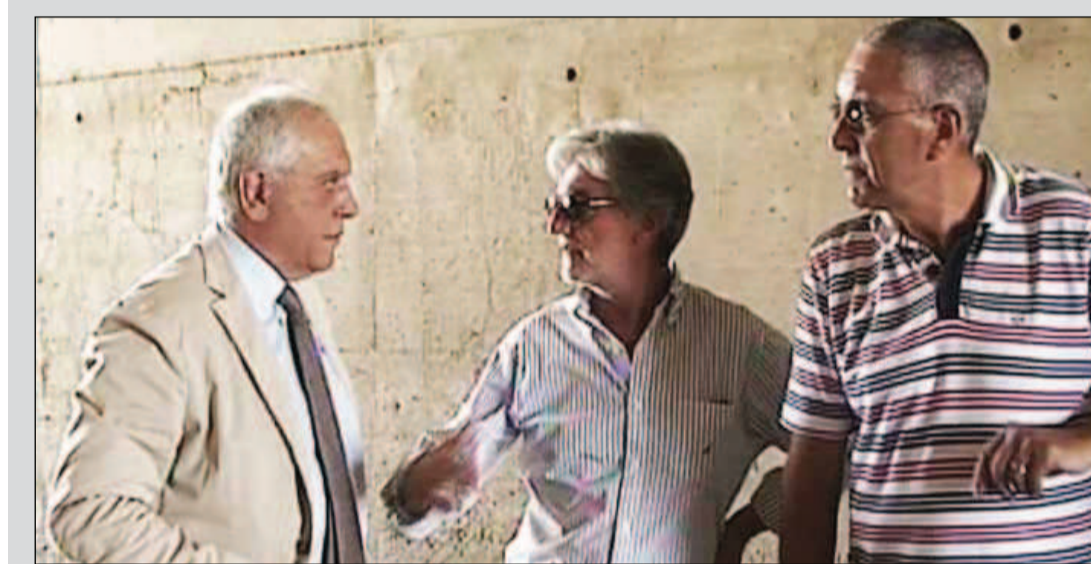
In foto, l'inaugurazione delle idrovore ai sottopassi del circuito.