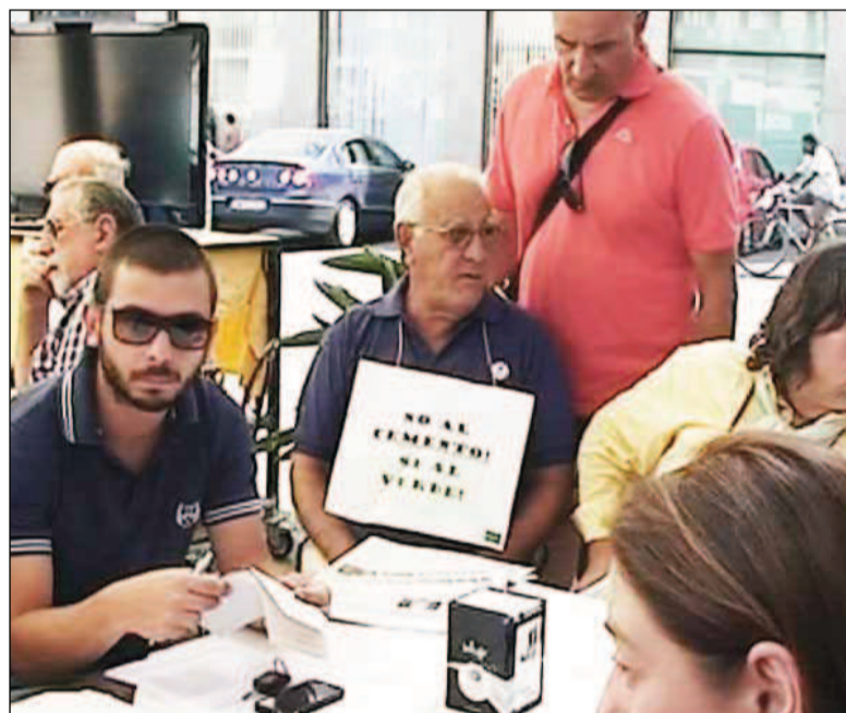
In foto, la riunione di “Sos Siracusa”.

“Dopo avere provato, senza successo, a bloccare l'efficacia del piano paesaggistico con una serie di ricorsi al TAR di Catania, coloro che lo osteggiano adesso provano a percorrere un'altra strada: quella dello svuotamento dello strumento dalle prescrizioni più stringenti a tutela del paesaggio e della discussione al di fuori delle sedi istituzionalmente preposte per l'esame dello stesso”. Questo sostengono i rappresentanti del movimento Sos Siracusa, che ieri mattina hanno incontrato la stampa per fare il punto della situazione sulle attività che intendono portare avanti a difesa del territorio siracusano. Con una serie di ordinanze emesse nel corso degli ultimi due mesi il TAR di Catania ha rigettato le istanze cautelari proposte nell'ambito dei ricorsi avanzati dalla Provincia Regionale.