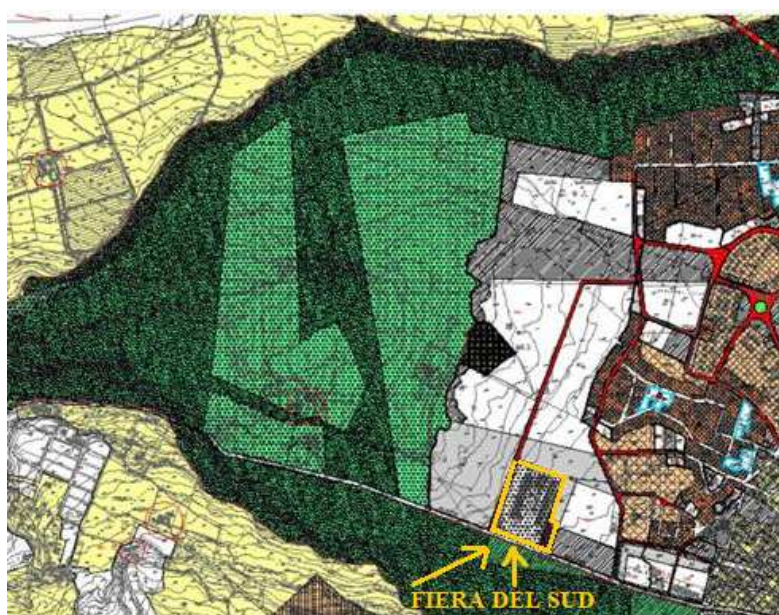
Fig. 1- Piano regolatore: aree bianche edificabili, aree grigie parcheggi e servizi